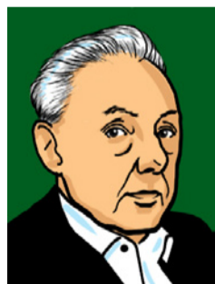
Joachim Kaiser für SZ-Magazin.