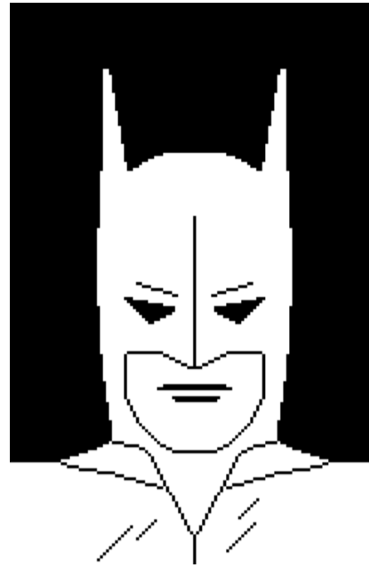
Digitale Zeichnung von Batman für farfetch.com.