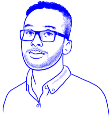
Abdigani Diriye für MIT Technology Review.